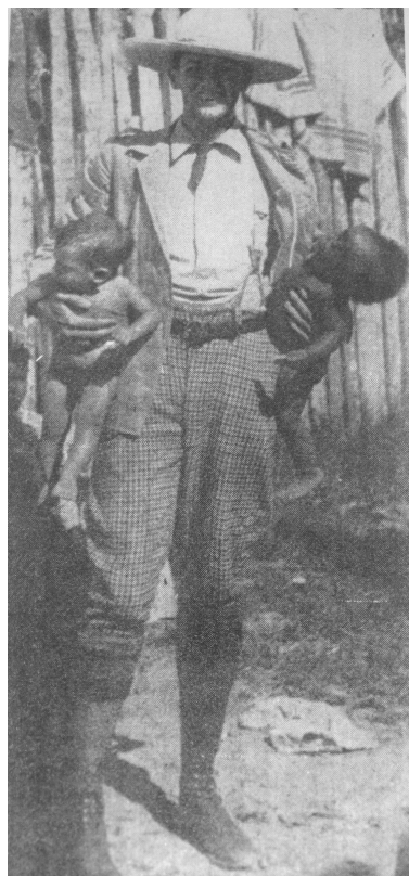
9. Walter Townsend, fotógrafo de Our Island and Their People

La pose desperdiga a hombres, niños y mujeres (imagen 2). La perspectiva distante acentúa la fragmentación del grupo y destaca, casi en perfecto semicírculo, la ausencia de lazos parentales precisos, excepto el que sugiere la débil proximidad de las figuras que ocupan el centro. No es difícil inferir la intencionalidad del cronista a través de las elecciones, en apariencia técnicas, de las que se vale para disponer y exhibir el objeto fotografiado. El desparramo de sujetos inscribe “una percepción cultural y una determinación ideológica” (Trachtenberg 1985: 188) en la que el desdibujamiento de parentescos graba los cuerpos de otros sentidos: los que exacerbaban lo pulsional.