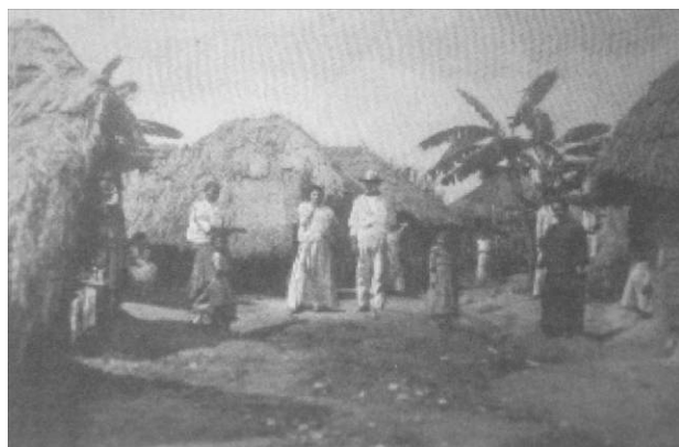
2. “Aldea de peones en Caguas”

Las paredes están empapeladas, no con decoraciones pero sí con utensilios de comida hechos corrientemente de calabazas. La comida se hace afuera de las casas [...] sobre una lámina de acero o en una pequeña cacerola y los alimentos son servidos en calabazas almacenadas y comidos con cucharas de calabazas. (Dinwiddie 1899: 160-162).