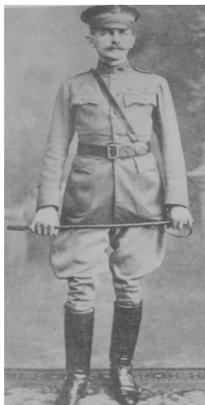
7. Coronel Bailey Ashford, cuerpo médico del ejército de Estados Unidos

Los ojos de Bailey Ashford no se dirigen a la cámara. 11 El giro leve del rostro abre el radio de la mirada y la proyecta en sesgo hacia delante, insinuando la existencia de un horizonte lejano, abierto. Las fotos del coronel del cuerpo médico del Ejército de los Estados Unidos dejan entrever los vínculos entre ciencia y poder imperial, y nos introducen en la trama donde aquellos cuerpos agredidos por el descontrol alimentario cobran otras significaciones a la luz del programa colonizador.