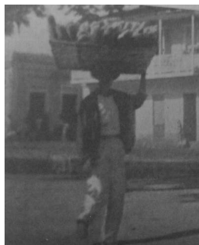
5. "Bread Wagon"

La espectacularidad es el matiz impreso por el cronista al ritual alimentario de los puertorriqueños. Así como la incongruencia en la decoración lo impacta al punto de suscitarle, como dijera Dinwiddie, "una impresión de horror", aquí la crispación se apresura ante la disposición inapropiada y el carácter antinatural de los alimentos. La movilidad de la escena, lograda por el uso del presente, de verbos y sustantivos indicadores de avance y ordenamiento, se transforma en dinámica sin concierto por impulso del calificativo que instala, desde la negación, la rutina normada y conveniente de la dieta del observador.