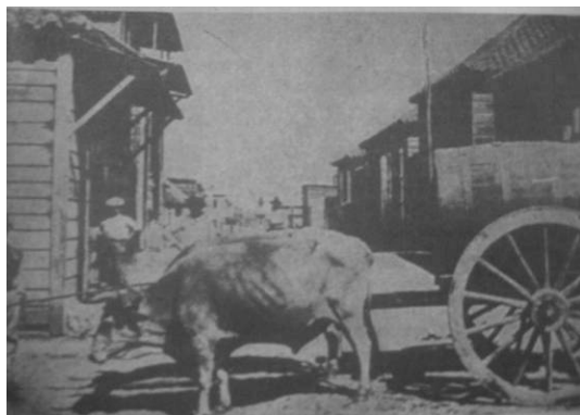
4. "Arecibo Water Supply"

ventajas del progreso y la perentoriedad del proyecto civilizador.