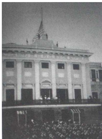
1. “Raising the American flag”

Cientos de máquinas fotográficas capturaron el instante que habría de convertirse en una de las imágenes más potentes del cambio de dominación de Puerto Rico en 1898: la bandera multiestrellada flameando en el mástil de la fortaleza frente a la plaza del Viejo San Juan, ante una multitud que observa —en posición solemne— el acto de entrega de la isla (imagen 1).