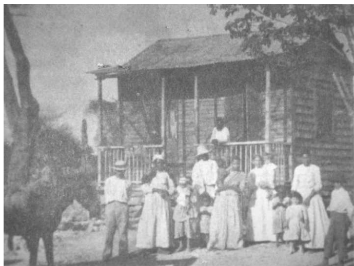
10. “Familia extendida campesina”

La censura aplicada a la vida licenciosa se recrudece ante la profusión de niños en las casas campesinas (imagen 10). Entonces asoman otra vez el espanto y la sorpresa, ahora enlazando la descripción con formas propias del relato no exentas de impulso moralizante. 13 Si bien la mirada es el dispositivo a través del cual se recobra la escena, la intervención de ciertos matices narrativos instaurados por formas verbales connotadoras de progresión y dilación temporal, y la aglomeración y el exceso traídos por la repetición y el desequilibrio entre hombres y mujeres dotan de fuerza argumentativa al pasaje y subrayan las propiedades que atentan contra la mentalidad funcional de la cronista: la falta de uno de los valores asociados con los sistemas modernos de regulación social —el aprendizaje del control de la natalidad— y su consecuencia indeseada —el crecimiento indiscriminado del cuerpo social. La desnudez se torna nuclear en esta percepción del desenfreno de las pasiones de los cuerpos: “Las jíbaras haraganean en la puerta con una sola y delgada prenda sobre ellas, tan desprendida y abierta como para exponer una parte importante de sus anatomías; el resto es visible a través de la transparencia del vestido.” (Hamm 1899: 84).