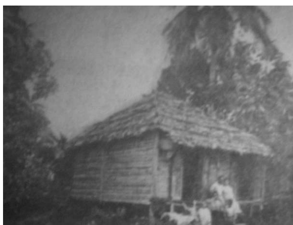
3. “Bohío campesino en Bayamón”

Ya como telón de fondo o al pie de desbordantes vegetaciones que los abrazan y de las cuales asoman como una prolongación o solitarios sobre una geografía casi yerma (imagen 3), los bohíos ganan protagonismo sobre otras edificaciones del interior isleño y apuntalan aquella óptica interesada en validarse como alternativa de un futuro promisorio. Aunque prescindan de descripciones complementarias, las fotografías hilvanan las pretensiones de la mentalidad conquistadora que regula la distancia relativa de los elementos en la escena. El ajuste del campo de la visión que coloca los bohíos en primer plano no sólo convierte las imágenes en correlatos visuales de la asfixia, la oscuridad y la estrechez verbalizadas con recurrencia; 10 también documenta su fragilidad y activa su condición desechable.