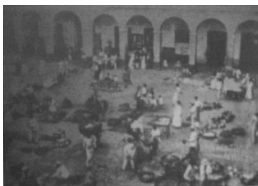
6. "Plaza del Mercado de San Juan"

Citando a Revel, Schavelzon recuerda que "ninguna gastronomía es inocente"; responde "a una realidad social, a la historia de una sociedad determinada en un momento determinado" y aun "la elección de los alimentos y su forma de preparación es también respuesta a una historia" (2002). Nada más lejos de esta perspectiva que la asumida por el viajero a la hora de informar sobre los platos habituales en las mesas isleñas. Su mirada se tiende oblicuamente sobre ellos sin reparar en las variables históricas y sociales ni en los productos naturales del suelo tropical que consolidaron hábitos de alimentación, modos de cocción y sazónamiento. Fiel a la observancia de sus hábitos, con la piel adaptada a la oscilación entre el estío y la nieve, y con su estómago acostumbrado a la dieta balanceada por esas variaciones, agudiza la visión y se encamina hacia reflexiones comprometidas con la implementación de medidas para atemperar las consecuencias del desbarajuste alimentario. "El efecto desastroso de la dieta de carnes en climas tropicales deberá ser espaciada por los médicos expertos..." (Dinwiddie 1899: 151).